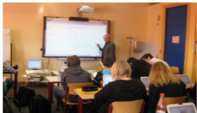
Die Netbookklasse des Gymnasiums Neuhaus

Die Netbookklasse verfügt über 25 Netbooks vom Typ scieneo der Firma Dynatec, welche über einen 10"-Display mit Tablet-Funktion per Stift bedient werden können. Alle Netbooks sind mit Windows 7 und WLAN ausgestattet. Dazu ist ebenso eine elektronische Whiteboardtafel vorhanden.